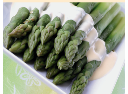
Ob grün oder gelb, Spargel war wohl noch nie so beliebt wie heutzutage.

Der Johannistag, der 24. Juni also, ist üblicherweise der letzte Erntetag für deutschen Spargel (grün oder weiß), damit sich genügend Laub entwickeln kann, über das die Wurzeln Kraft fürs nächste Erntejahr gewinnen können. Darum gibt es nur noch kurze Zeit frischen Spargel aus der Region. Dabei ist das Gemüse mit nur 17 kcal/100 g besonders energiearm. Es regt den Stoffwechsel an und hat wegen des hohen Kalium- u. Eisengehaltes eine entwässernde und blutreinigende Wirkung. Auch der Vitamin- und Mineralstoffgehalt ist beachtlich. Spargel ist