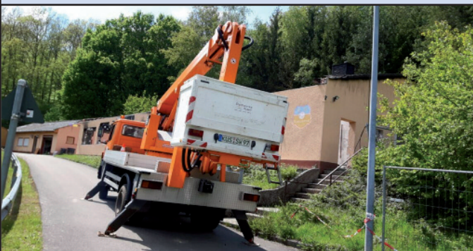
Hubsteiger der Stadtwerke kurz vor dem Einsatz beim SV Rammelsbach

Auf Nachfrage sprangen die Stadtwerke Kusel dem Verein mit ihrem Hubsteiger gern zur Seite. Ein Mitarbeiter der Stadtwerke übernahm nach Feierabend ebenfalls ehrenamtlich die Bedienung des Korbes. So konnte die Stromleitung problemlos an den Flutlichtmasten abgeklemmt und für die Zuleitung zur Unterwasserpumpe verwendet werden. Ideen muss man eben haben!